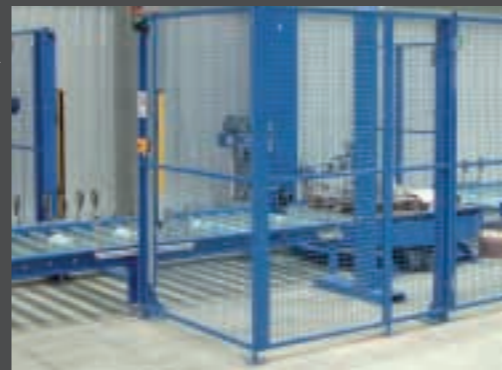
Absicherung einer Palettenförderstrecke