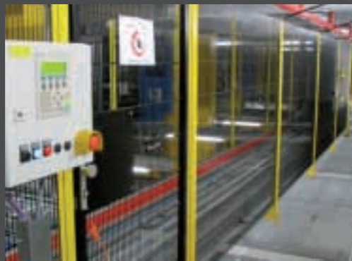
Absicherung eines automatischen Palettenregallagers